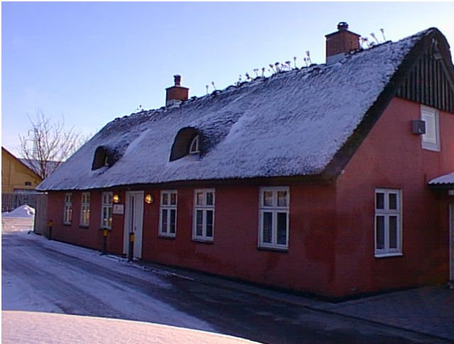
Gug skole indtil ca. 1900.