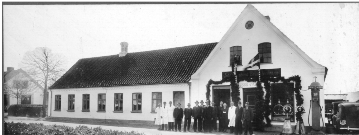
Fra brugsens jubilæum i 1938.