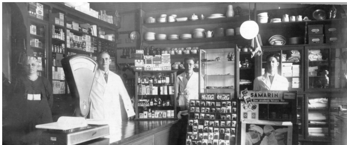
Interiør fra brugsen ved jubilæet i 1938.

Så hver vinter fra september til april, lavede jeg opgaver, som blev sendt til skolen, og til slut var jeg på skolen i Middelfart en uge, for at afslutte med eksamen.