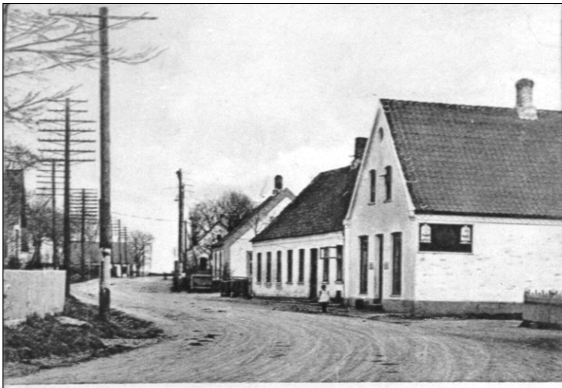
Brugsen ca. 1918.