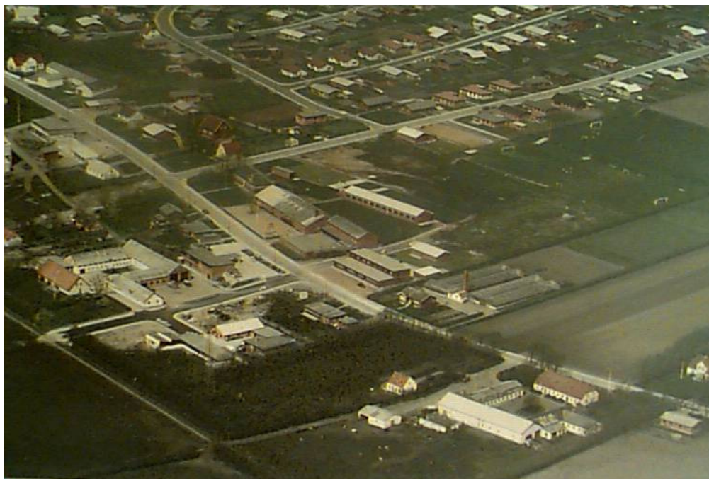
Billedet er fra 1966 og viser de omtalte bygninger.