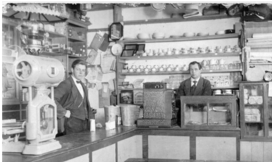
Brugsen ca. 1920.

I min læreplads havde vi ikke foderstoffer og gødning eller trælast, det kom jeg først til at beskæftige mig med, da jeg kom til Vendsyssel.