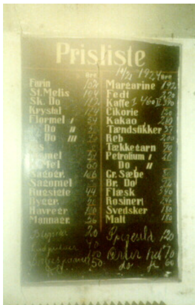
Den omtalte tavle.

der en pristavle fra en endnu ældre butik til syne, den var lavet i et blændet vindue. Muren var malet sort, og forskellige varer var malet med hvidt, og så noterede man de aktuelle priser med kridt.