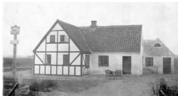
Bettemurerens hus set fra Vissevej

kolade fra Toms Fabrikker. Jeg skulle komme hver aften og vaske op fra hele dagen. Jeg skulle først ud med aviserne hver dag. Toget kom ved firetiden, så det var bare med at komme i gang.