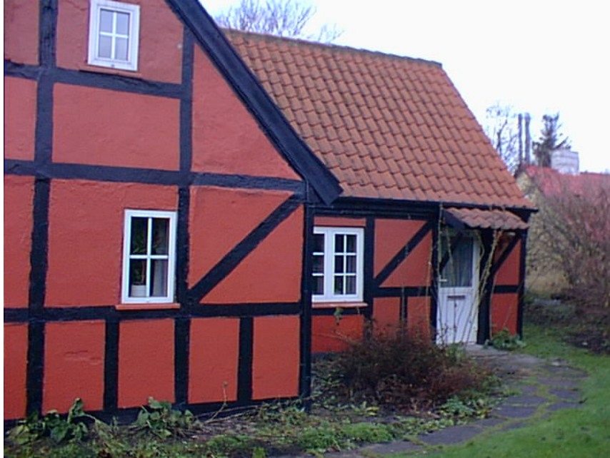
Huset set fra Vissevej