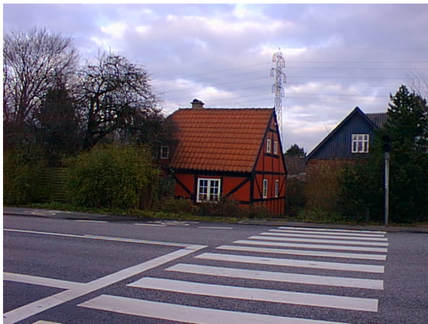
Dette og de næste to billeder viser huset som det ser ud i 2001.