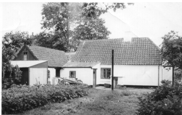
Huset set fra vest

Far satte tegnebogen i hans lomme igen. Da de var ved at forbinde hans hånd, stønnede han: Åh, mit ben! De tog sko og strømper af ham. Den ene sko var fyldt med blod, og det viste sig, at han havde skåret foden næsten af. Mor måtte op på centralen for at ringe efter ambulancen. Far var ikke så glad for at sende mor af sted, for der kunne jo være flere, men mor var aldrig bange. Da hun gik hen ad vejen, kom der en fin dame hen til hende og sagde at han var sprunget ud af en bil, og det var der, han havde skåret sig. De havde jagtet ham i bil over en stubmark. Han kom på sygehuset, og senere fik far at vide, at det var en stor slagtermester fra Brønderslev. De mennesker mor snakkede med, var nogle fra en stor gård. Jeg kan ikke huske, hvad gården hed, men folkene hed Gregersen. Slagtermesteren kom aldrig og betalte noget. Mor havde revet et lagen i stykker og svinet både håndklæder og divan med blod, men så havde de da gjort en god gerning. Han var godt nok stor, sagde far, men der skal godt nok meget til at klare den „bitte murer“, sagde han.