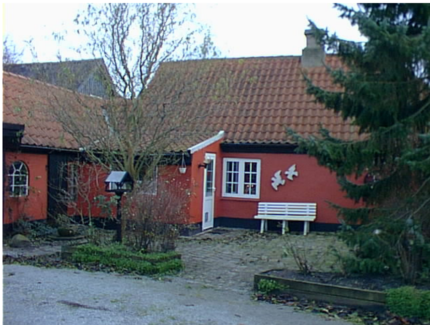
Huset set fra gårdsiden