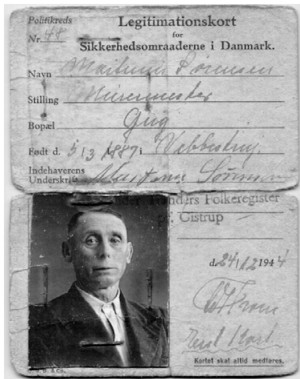
Legitimationskort fra 2. Verdenskrig.

ede da at sige til bilisten: „Hva’ fanden bilder do dæ in, ska’ do kyr mæ nir“.